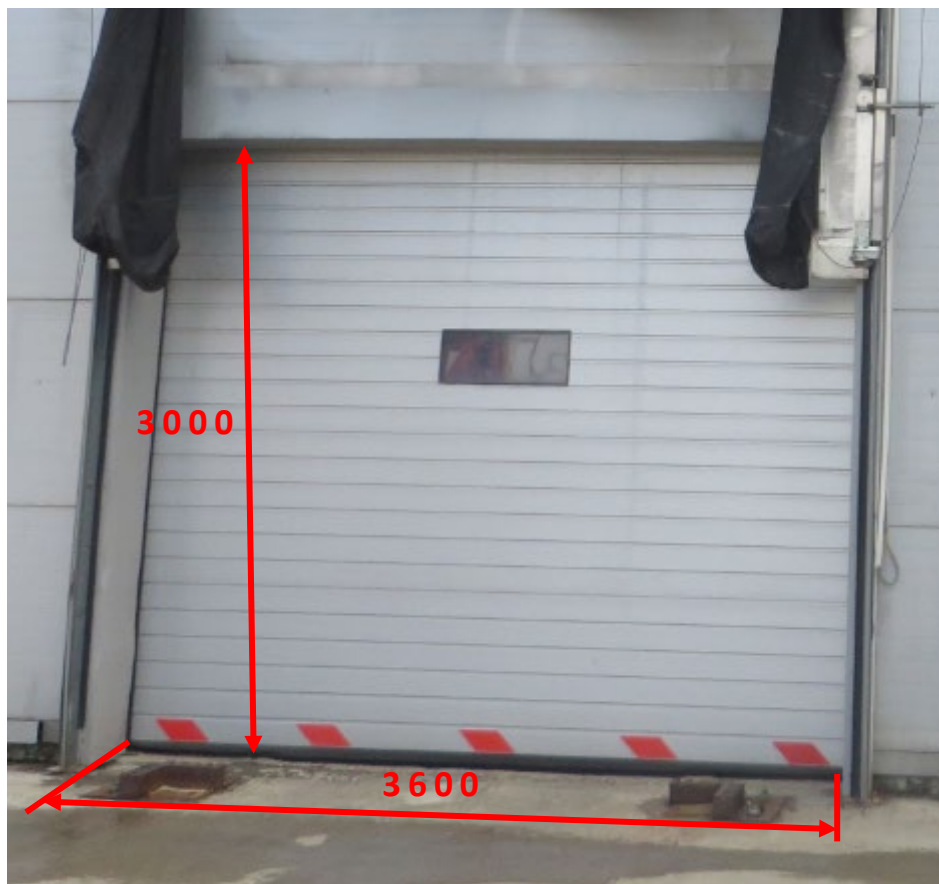
Рисунок 2. Промем ворот.

Контрагент осуществляет монтаж трех герметизаторов силами своих специалистов и с использованием своего инструмента и расходных материалов, необходимых для работы герметизаторов. АГР готов предоставить при необходимости в распоряжение Контрагента вилочный погрузчик с грузоподъемностью 4 тонны и вертикально-мачтовый подъемник (типа Haulotte star 10), при наличии разрешений на управление данной спецтехникой у специалистов Контрагента. При необходимости АГР подводит электропитание непосредственно к местам монтажа герметизаторов (в приоритете необходимо рассмотреть вариант использования электропроводки от старых герметизаторов), подключение осуществляет Контрагент. После монтажа и подключения герметизаторов Контрагент проводит пусконаладочные работы. Некоторые размеры старых герметизаторов и проема ворот указаны на Рисунках 2-4. Во избежание ошибок при составлении коммерческого предложения для проведения всех необходимых точных измерений Контрагент должен посетить АГР.