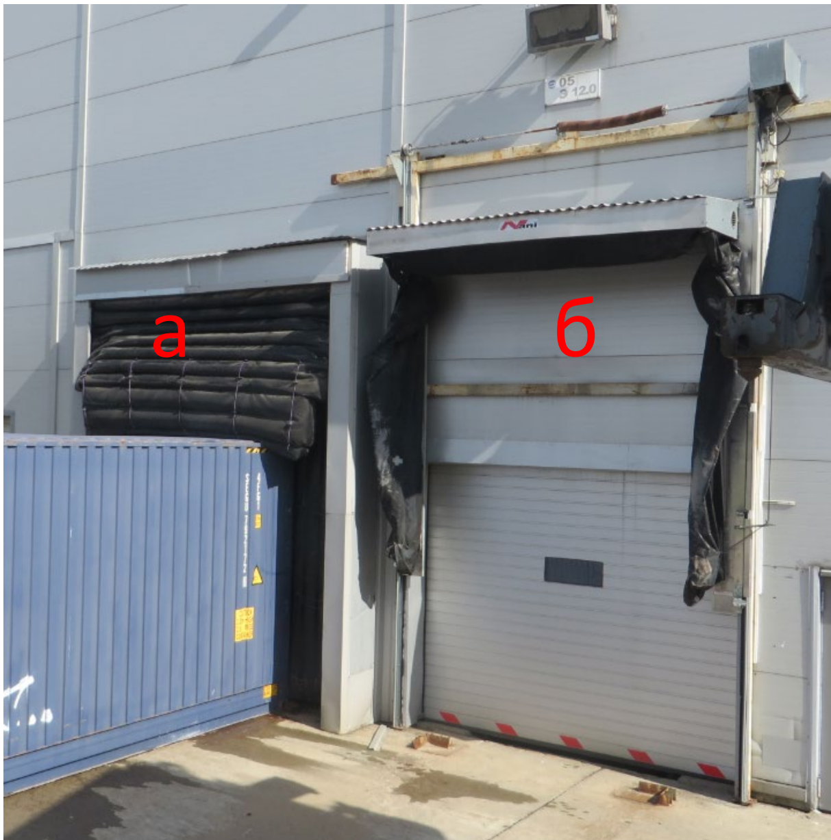
Рисунок 1. Герметизаторы со стационарным (а) и опускаемым (б) проемом.

Выгрузку герметизаторов АГР проведет самостоятельно, силами своих сотрудников и техники.