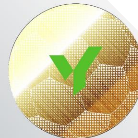
Candy gold yellow