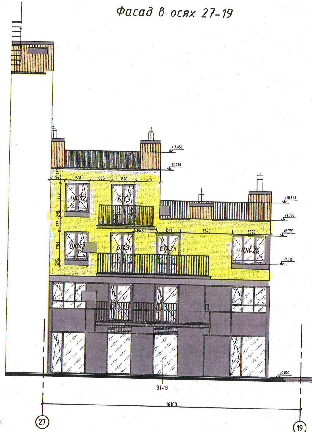
Фасад в осях 27-19