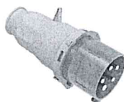
Ответная вилка 380В выход с удлинителя